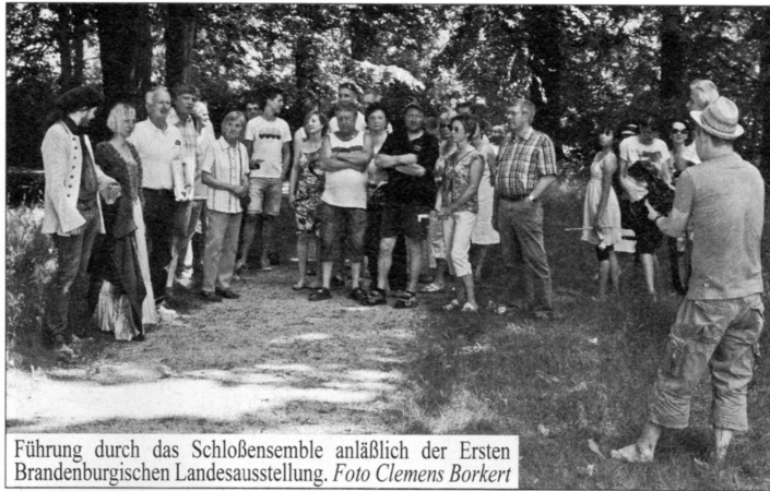
Führung durch das Schloßensemble anlässlich der Ersten Brandenburgischen Landesausstellung.

nen Hasel ( Corylus avellana ), ein Vertreter der Birkengewächse, bestehen aus vielen kleinen Blüten, die in diesen männlichen Blütenständen aneinander gereiht sind. In den Blüten wird der Pollen gebildet. Bei trockenen Wetterverhältnissen kann dieser vom Wind als regelrechte Staubwolke weggetragen werden, um auf einem benachbarten Haselstrauch die weiblichen Blüten zu befruchten – oder auf den Nasenschleimhäuten Beschwerden zu verursachen. Es werden sehr große Mengen an Pollen produziert, um die Wahrscheinlichkeit einer Befruchtung zu erhöhen – sehr zum Leidwesen der betroffenen Allergiker. Die weiblichen Blüten sind aufgrund der geringen Größe sehr unscheinbar und werden oft übersehen, obwohl sie schön rot gefärbt sind. Nach erfolgter Befruchtung wird der Samen gebildet, der bekannterweise die Haselnuß ist. Bei Allergien gibt es diverse Strategien, wie man die Symptome lindern kann. Zuerst sollte eine Allergie ärztlich abgeklärt werden, wo der Arzt beispielsweise einen Hauttest durchführt, um die Allergieauslöser herauszufinden. Nach erfolgter Diagnose können zur Linderung Antihistaminika in Form von Augentropfen, Nasen-